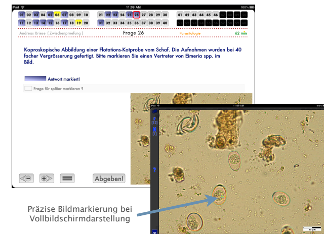
Präzise Bildmarkierung bei Vollbildschirmdarstellung

Im Anschluss an die Prüfung kann eine Evaluation bspw. der Prüfung selbst, der Lehrveranstaltung oder der Studiensituation direkt angeschlossen werden.